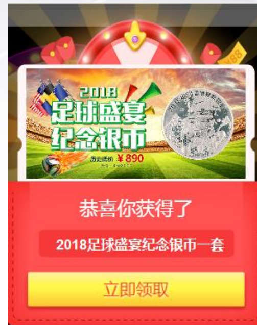
Step2: 弹出广告素材, 中奖信息