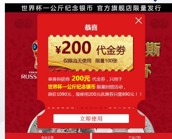
Step3: 进入广告落地页领取奖品