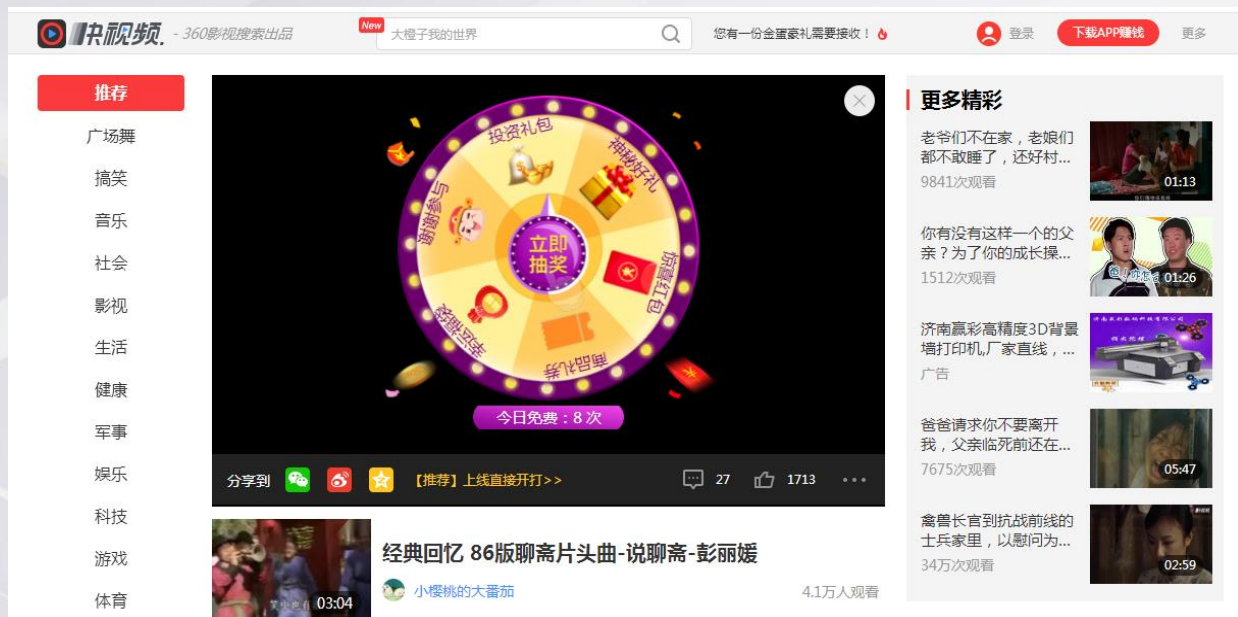
Step1: 进入互动场景, 点击抽奖